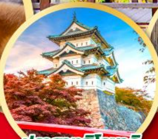
ปราสาทฮิโรซากิ