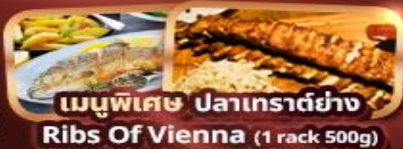
เมนูพิเศษ ปลาเทราต์ย่าง Ribs Of Vienna (1 rack 500g)