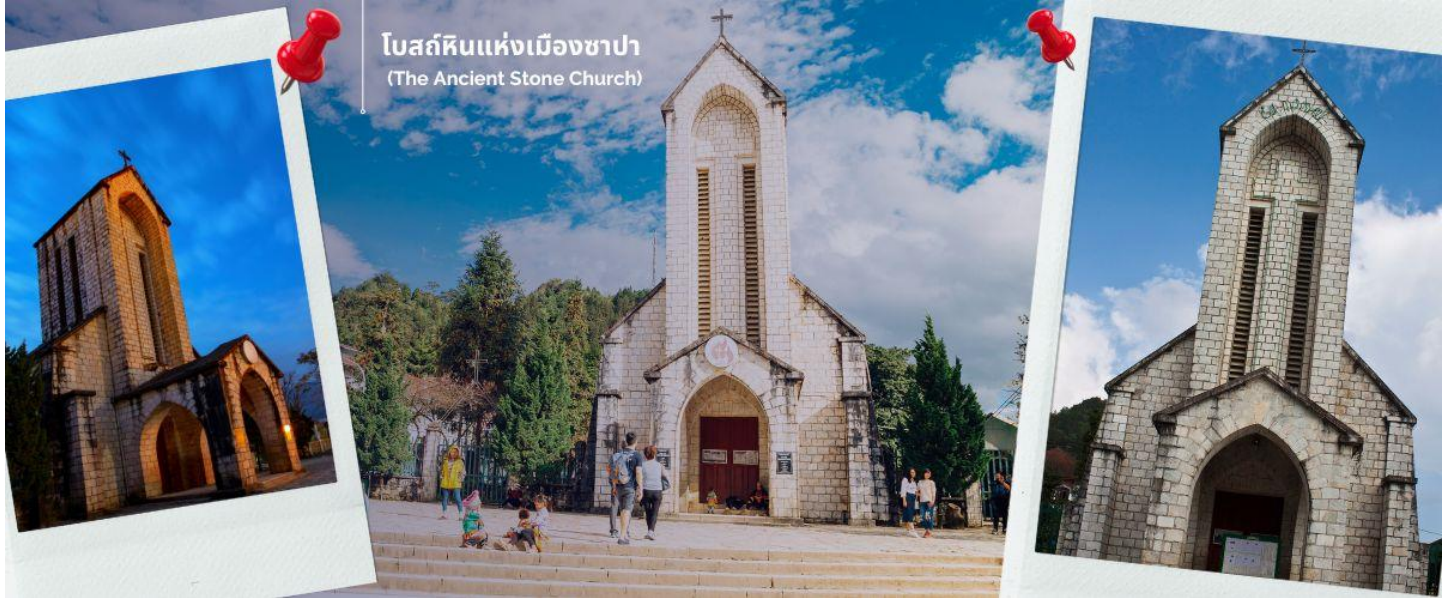
โบสถ์หินแห่งเมืองซาปา (The Ancient Stone Church)

นำท่านช้อปปิ้งที่ ตลาดไนต์เมืองซาปา มีสินค้าให้ท่านเลือกช้อปปิ้งมากมาย ไม่ว่าจะเป็นสินค้าพื้นเมือง ของฝาก ขนม กระเป๋า รองเท้า ท่านสามารถช้อปปิ้งได้อย่างจุใจ