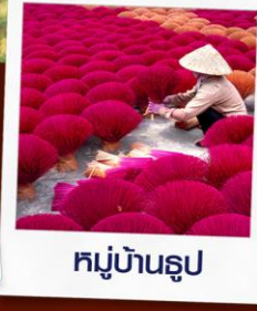
หมู่บ้านรูป