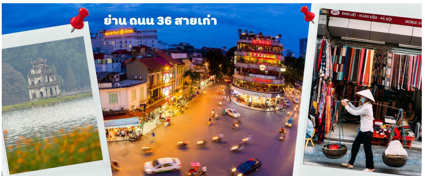
ย่าน ถนน 36 สายเก่า

จากนั้นให้ท่านได้ อิสระช้อปปิ้ง ถนนสาย 36 street แหล่งช้อปปิ้งของฮานอย มีต้นไม้ปกคลุมสองฝั่งถนน สาเหตุที่ชื่อถนน 36 มาจาก 36 อาชีพที่ทำการค้าขายบนถนนแห่งนี้ ตั้งแต่อดีตอย่างงานด้านหัตถกรรมสอดคล้องกับชื่อถนนแต่ปะเส้น ในอดีตอย่าง เครื่องเงิน ผ้าไหม บนถนนแห่งนี้ แต่ปัจจุบันมากกว่า 36 ไปแล้ว ที่นี้จะเป็นแหล่ง Shopping มีสินค้าเกือบทุกชนิด ร้านขายชุดกีฬาามีทุกแบรนด์เพราะที่นี่เป็นแหล่งผลิตให้หลาย ๆ แบรนด์