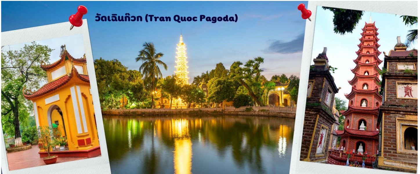
วัดเจินก๊วก (Tran Quoc Pagoda)

จากนั้นนำท่านไป วัดเจินก๊วก (Tran Quoc Pagoda) เป็นวัดที่อยู่ใจกลางเมืองของเวียดนาม ใกล้ชิดกับทะเลสาบตะวันตกของเมืองฮานอย สร้างด้วยสถาปัตยกรรมจีนโบราณ มีความร่มรื่น และบรรยากาศดี จึงเป็นที่นิยมของนักท่องเที่ยวทั้งที่ชื่นชอบความงามและมีศรัทธาในพระพุทธศาสนา จากภาพมุมสูงของสถานที่ตั้ง ที่นี้เหมือนตั้งอยู่บนเกาะที่ยื่นลงไปในทะเลสาบ แต่มีเส้นทางคมนาคมเข้าถึงที่ สิ่งปลูกสร้างมีการวางผังเป็นอย่างดี ใช้สีสันทึกลมกลืนในโทนสีเหลือง น้ำตาล ตัดกับสีเขียวของต้นไม้ใหญ่ที่โอบล้อมอยู่ในมุมถ่ายภาพจากอีกฝั่งหนึ่ง จะเห็นสิ่งปลูกสร้างสไตล์จีน และเจดีย์หลายชั้นโดดเด่น มีภาพที่สะท้อนลงสู่ผิวน้ำ เป็นภูมิทัศน์ที่งดงามทั้งยามกลางวันและยามค่ำคืนที่มีการเปิดไฟส่องสว่าง