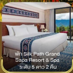
พัก Silk Path Grand Sapa Resort & Spa ระดับ 5 ดาว 2 คืน