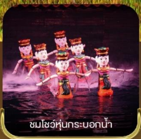
ชมโชว์หุ่นกระบอกน้ำ