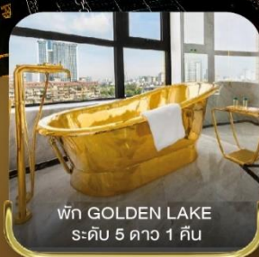
พัก GOLDEN LAKE ระดับ 5 ดาว 1 คืน