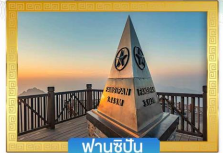
ฟานซีปัน