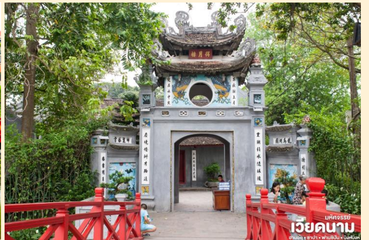
มัทศจรีย์ เวียงคานาม ฮานอย • ซาปา • ฟานซิปัน • นิงห์ฮิงห์

จากนั้น นำท่านชม สะพานแสงอาทิตย์ สีแดงสดใสอยู่กลางทะเลสาบคินดาบ ชมวัดโบราณ วัดหังอกเซิน (ด้านนอก) สถานที่แห่งนี้มี เต่าสตัฟ ขนาดใหญ่ ซึ่งมีความเชื่อว่า เต่าตัวนี้ คือเต่าศักดิ์สิทธิ์ 1 ใน 2 ตัวที่อาศัยอยู่ในทะเลสาบแห่งนี้มาเป็นเวลานาน