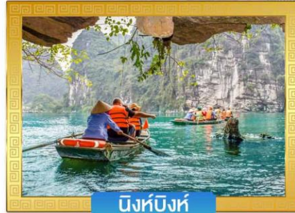
นิงห์บิงห์