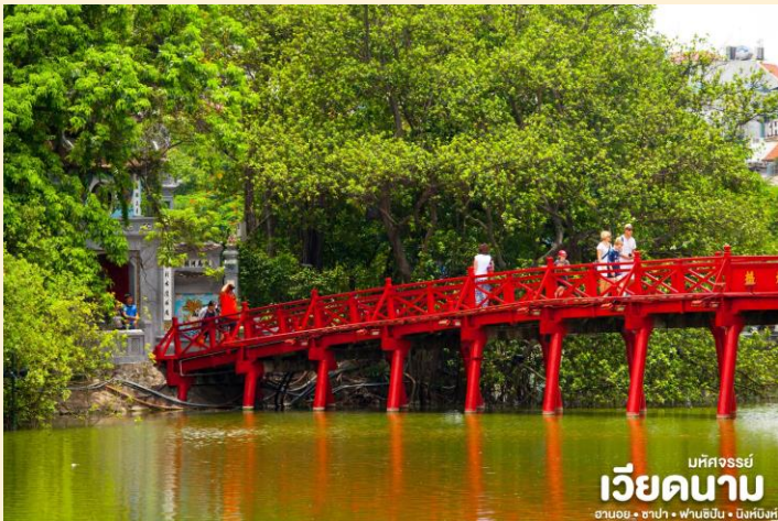
มัทศจรีย์ เวียงคานาม ฮานอย • ซาปา • ฟานซิปัน • นิงห์ฮิงห์