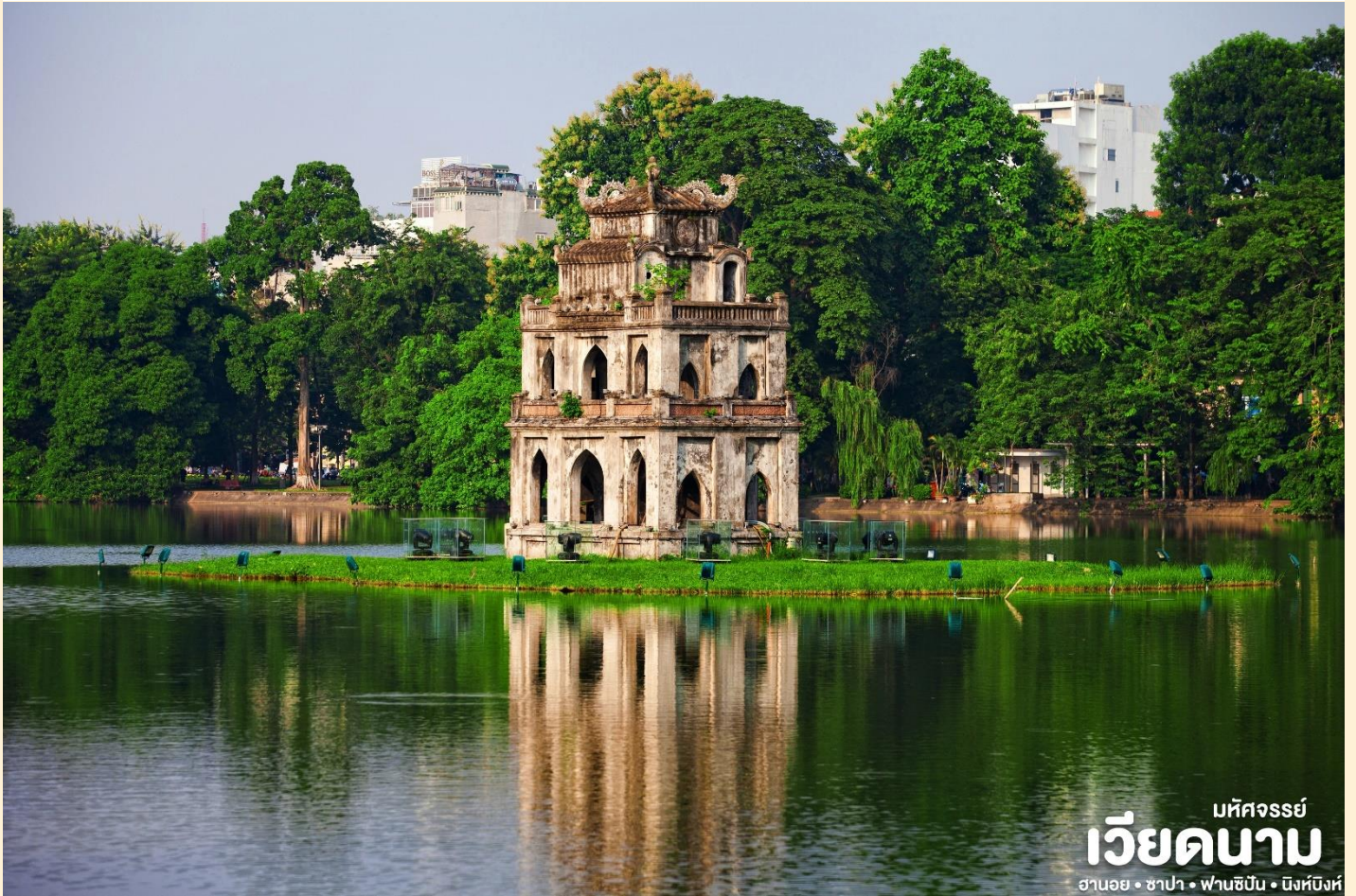
มัทศจรีย์ เวียงคานาม ฮานอย • ซาปา • ฟานซิปัน • นิงห์ฮิงห์