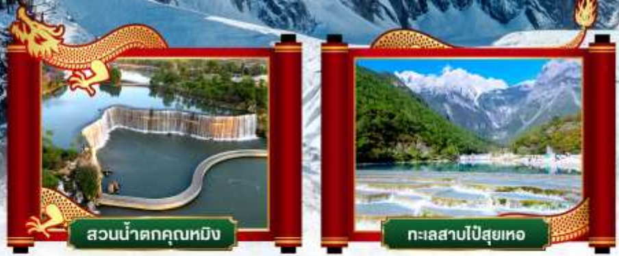
สวนน้ำตกคุณหมิง

✓ พิเศษ! โชว์จางอวีโหม่ว "ความประทับใจลี้เจียง"