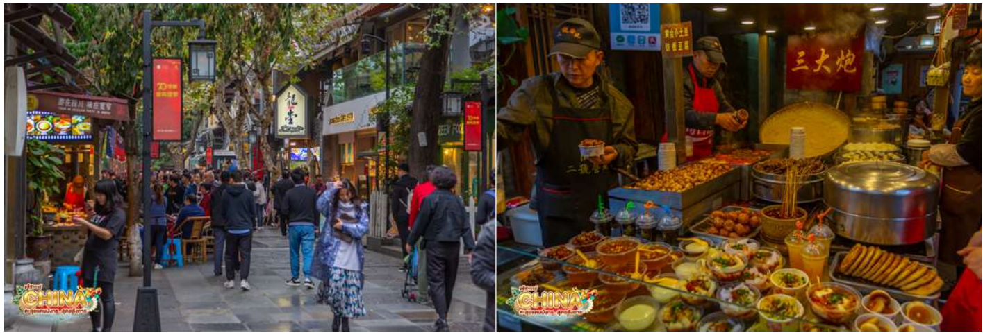
** อิสระอาหารเย็นตามอัธยาศัย เพื่อความสะดวกในการช้อปปิ้ง **

เช้า ๑๐ บริการอาหารเช้า ณ ห้องอาหารโรงแรม จากนั้น ออกเดินทางสู่ เมืองเฉิงตู (ใช้เวลาเดินทางประมาณ 3 ชั่วโมง) กลางวัน ๑๐ บริการอาหารกลางวัน ณ ภัตตาคาร จากนั้น ชมชัชวบรรยากาศ ถนนโบราณจินหลี่ เป็นถนนคนเดินอยู่ติดกับศาลเจ้าสามก๊ก หรือศาลเจ้าขงเบ้ง (จูกัดเหลียง) มีสินค้าให้ช้อปปิ้งได้ทั้งของรับประทานและของฝากของที่ระลึก หากกำลังมองหาของที่ระลึกที่มีสัญลักษณ์ของเมืองเฉิงตู อาทิ หมี่แพนด้า ตุ๊กตาเปลี่ยนหน้ากาก ชา ผ้าไหม และยาสมุนไพรต่างๆ ก็สามารถมาเก็บครบรวดเดียวได้ที่นี้ และเดินเที่ยว ถนนชอยกว้างชอยแคบ เป็นถนนที่แสดงถึงวิถีชีวิตของคนจีนเฉิงตูในสมัยโบราณ ผสมความเป็นทันสมัยเข้าไปอย่างลงตัว ถนนคนเดินมี 3 ซอย แต่ละซอยมีความยาวประมาณ 400 เมตร มีร้านค้าเล็กๆ ตั้งเรียงรายอยู่ในแต่ละซอยและตรอกให้เดินช้อปปิ้งเพลิน ทั้งร้านหนังสือ ร้านชา-กาแฟ บาร์ เสื้อผ้า ไปจนถึงร้านอาหารนานาชาติ