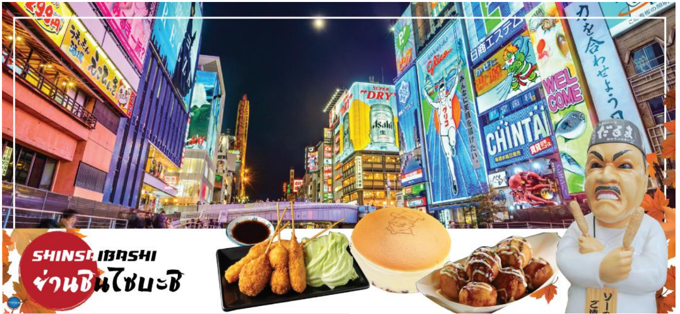
เย็น อิสระรับประทานอาหารเย็นตามอัธยาศัย

จากนั้นอิสระช้อปปิ้ง ย่านชินไซบาชิ (Shinsaibashi) (ใช้เวลาเดินทางประมาณ 1 ชั่วโมง) บริเวณแหล่งช้อปปิ้งแห่งนี้มีความยาวประมาณ 600 เมตร เต็มไปด้วยร้านค้าปลีก ร้านแฟชั่นร้านเครื่องสำอางค์ ร้านรองเท้า กระเป๋า นาฬิกา ร้านกาแฟ ร้านอาหาร ร้านขนม ร้านเสื้อผ้าสตรีทแบรนด์ทั้งญี่ปุ่นและต่างประเทศ เช่น Zara H&M Beans ABC Mart เป็นต้น เรียกว่ามีทุกอย่างที่ต้องการรวมกันอยู่บริเวณนี้ ใกล้กันท่านสามารถเดินไปยัง ย่านโดทงโบริ (Dotonbori) ย่านบันเทิงยามค่ำ คินดอลอดแนวถนนเลียบบคลองโดทงโบริ จากสะพานโดทงโบริบาชิไปจนถึงสะพานนิปปอนบาชิ ไฮไลท์!!! ใครๆ ก็เชิคอิน ถ่ายภาพคู่ ป้ายกูลิโกะแมน หรือ ป้ายโดทงโบริกูลิโกะ (Dotonbori Glico Sign) เป็นป้ายไฟนีออนรูปนักกรีฑากำลังวิ่งอยู่บนลู่วิ่ง ซึ่งถูกติดตั้งมาตั้งแต่ ปี ค.ศ.1935 นอกจากนี้ยังมีอีกหนึ่งสัญลักษณ์สถานที่นัดพบกันหลง นั่นก็คือ ร้านปูคานิดอรากุ (Kani Doraku) ซึ่งมีปูยักษ์ขยับแขนและลูกตาได้อีกด้วย และห้ามพลาดสำหรับ ทาโกยากิ อาหารท้องถิ่นของชาวโอซาก้า ที่มาถึงถิ่นแล้วต้องลอง Original Taste รับรองไม่ผิดหวังแน่นอน