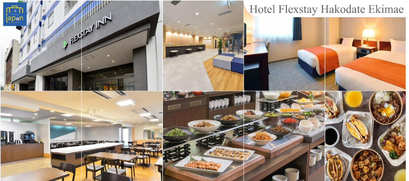
Hotel Flexstay Hakodate Ekimae

FLEX STAY INN HAKODATE EKIMAE หรือเทียบเท่าระดับเดียวกัน