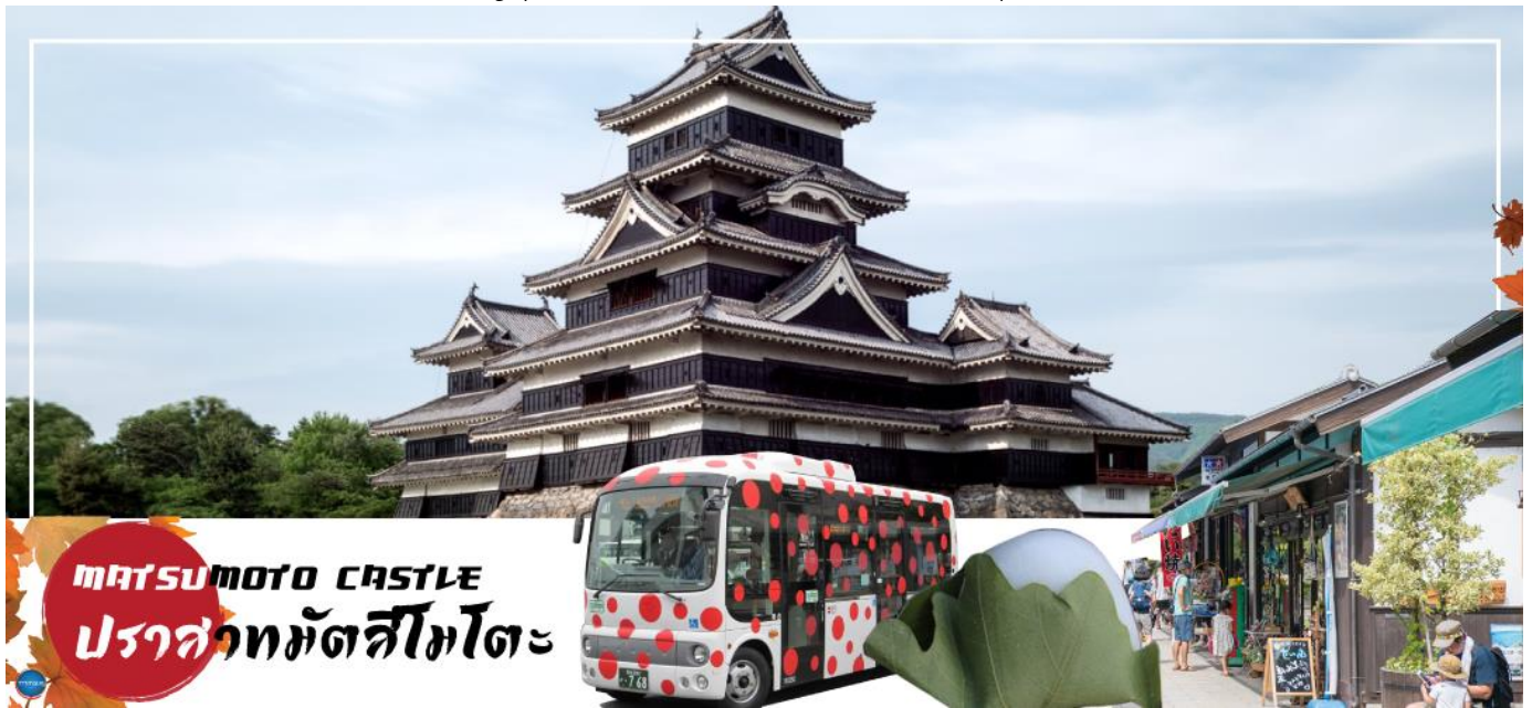
MATSUMOTO CASTLE ปราสาทมัตสึโมโตะ

นำท่านชม ปราสาทมัตสึโมโตะ (Matsumoto Castle) (ด้านนอก) เป็น 1 ใน 12 ปราสาทดั้งเดิมที่ยังคงสภาพสมบูรณ์และสวยงามที่สุดของประเทศญี่ปุ่น และเป็น 1 ใน 5 ปราสาทที่ได้รับการขึ้นทะเบียนเป็นสมบัติประจำชาติ เป็นปราสาทที่สร้างอยู่บนพื้นที่ราบ มีเอกลักษณ์ตรงที่มีหอคอยและป้อมปืนเชื่อมต่อกับโครงสร้างอาคารหลัก และเนื่องจากผนังปราสาทมีสีดำและปีกด้านต่างๆ ของปราสาทแผ่กางออกเหมือนปีกนก เลยมีชื่อเรียกว่า คาราซุโจ ที่แปลว่า ปราสาทอีกา สำหรับข้างในตัวปราสาทมีชั้นบันไดสูงชันและเพดานที่ไม่สูงมาก บริเวณทางเดินจัดแสดงวัสดุเครื่องใช้ทางประวัติศาสตร์ เช่น ชุดเกราะซามูไรสมัยเซ็นโงกุ, ปืนคาบศิลาและอาวุธที่เคยใช้สู้รบในสมัยก่อนหน้าต่างเป็นหน้าต่างไม้แคบๆ มีช่องสำหรับยิงปืนและยิงลูกธนู ท่านสามารถเพลิดเพลินกับทัศนียภาพของเทือกเขาแอลป์ญี่ปุ่นและเมืองมัตสึโมโตะได้จากชั้นบนสุดของปราสาทแห่งนี้