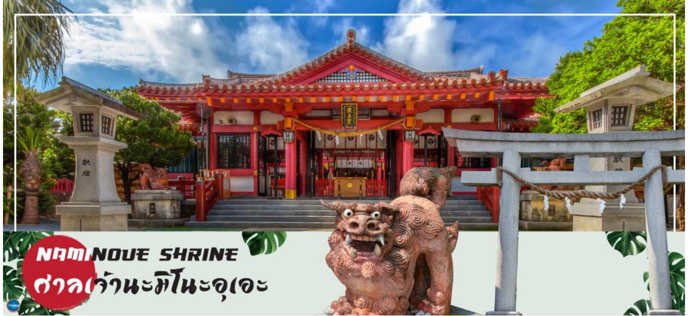
NAMINOUE SHRINE ศาลเจ้านะมิโนะอุเอะ

เช้า รับประทานอาหารเช้า ณ ห้องอาหารของโรงแรม (5)