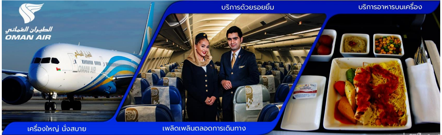
เครื่องบิน นิ่งสบาย

06:00 น. คณะผู้เดินทางพร้อมกัน ณ สนามบินสุวรรณภูมิ อาคารผู้โดยสารขาออกระหว่างประเทศ ชั้น 4 ประตูทางเข้าที่ 6-7 แถว M เคาน์เตอร์สายการบินโอมาน แอร์ ซึ่งมีเจ้าหน้าที่บริษัทฯ คอยให้การต้อนรับพร้อมอำนวยความสะดวกด้านสัมภาระแก่ท่าน