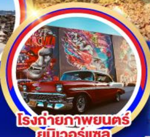
โรงถ่ายภาพยนตร์ยูนิเวอร์แซล