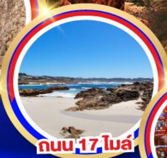
ถนน 17 ไมล์