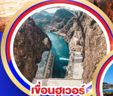
เชื้อนฮูเวอร์

ช้อปปิ้งใจเอ็งที่เลิควอนตารีโอมิลล์ ช้อปปิ้งบาร์สตอว์เอ็งที่เลิควอนตารี