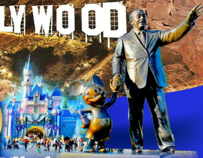
ดิสนีย์แลนด์

เดินทาง 20-29 ต.ค. 67 03-12 พ.ย. 67 01-10 ธ.ค. 67 29 ธ.ค. 67-07 ม.ค. 68