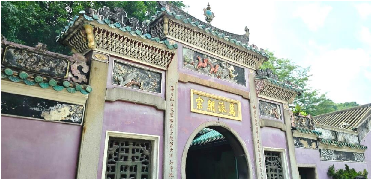
วัฒนธรรมตะวันออกและตะวันตกอย่างลงตัว

นำท่านเดินทางสู่ มาเก๊า (ในการเดินทางข้ามด่าน ท่านจะต้องลากกระเป๋าสัมภาระของท่านเองและผ่านพิธีการตรวจคนเข้าเมืองใช้เวลาในการเดินประมาณ 45-60 นาที) ในอดีตมาเก๊าเป็นเพียงแค่หมู่บ้านเกษตรกรรมและประมงเล็กๆ ซึ่งเป็นเมืองที่มีประวัติศาสตร์ยาวนาน โดยมีชาวจีนกวางตุ้งและฟูเจี้ยนเป็นชนชาติดั้งเดิม จนมาถึงช่วงต้นศตวรรษที่ 16 ชาวโปรตุเกสได้เดินเรือเข้ามายังคาบสมุทรแถบนี้เพื่อติดต่อค้าขายกับชาวจีน และมาสร้างอาณานิคมอยู่ในแถบนี้ ที่สำคัญ คือ ชาวโปรตุเกสได้นำพาเอาความเจริญรุ่งเรืองทางด้านสถาปัตยกรรม และศิลปวัฒนธรรมของชาติตะวันตกเข้ามาอย่างมากมาย ทำให้มาเก๊ากลายเป็นเมืองที่มีการผสมผสานระหว่าง