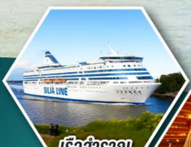
เรือสำราญ TALLINK SILJA LINE