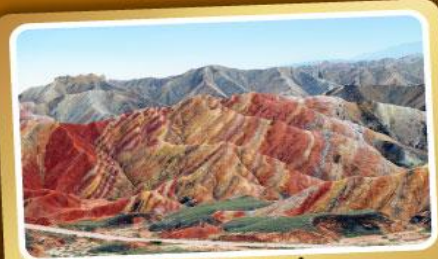
ภูเขาสายรุ้งจางเย่