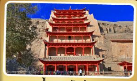
ถ้ำแกะสลักม่อเกา