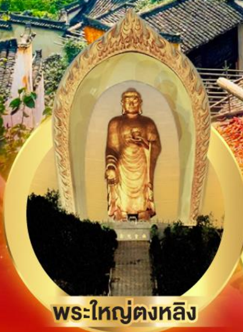
พระใหญ่ตงหลิง