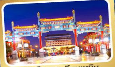
ถนนโบราณเฉียนเหมิน