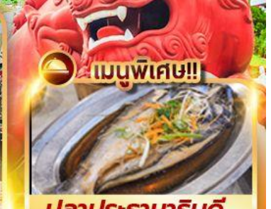
เมนูพิเศษ!! ปลาประรานาธิบดี