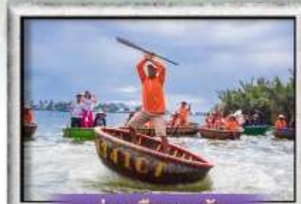
ล่องเรือกระดิ่ง