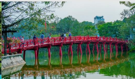
ทะเลสาบคินดาบ