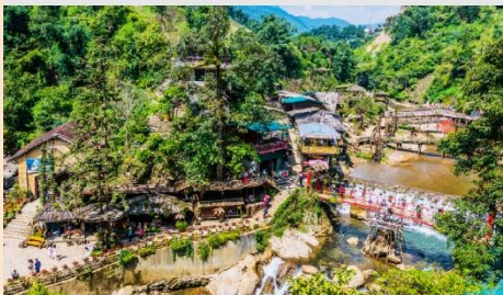
หมู่บ้าน Cat Cat