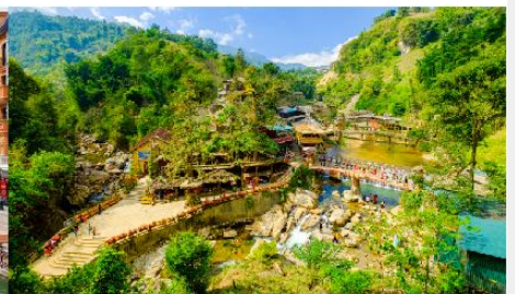
หมู่บ้านก๊ิต ก๊ิต

*ทางบริษัทฯ ขอสงวนสิทธิ์ในการสลับโปรแกรมทัวร์ตามความเหมาะสมขึ้นอยู่กับสถานการณ์หน้างาน โดยคำนึงถึงผลประโยชน์ของลูกค้าเป็นสำคัญ