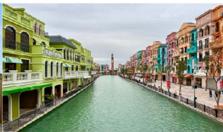
เมก้าแกรนด์เวิลด์ฮานอย