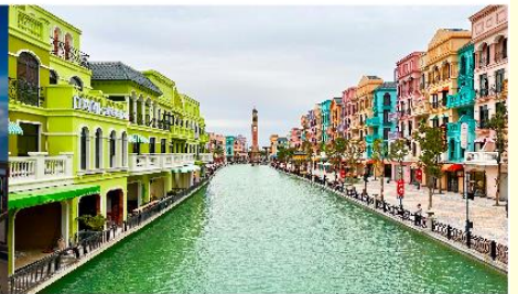
เมก้าแกรนด์เวิลด์ฮานอย

*ทางบริษัทฯ ขอสงวนสิทธิ์ในการสลับโปรแกรมทัวร์ตามความเหมาะสมขึ้นอยู่กับสถานการณ์หน้างาน โดยคำนึงถึงผลประโยชน์ของลูกค้าเป็นสำคัญ