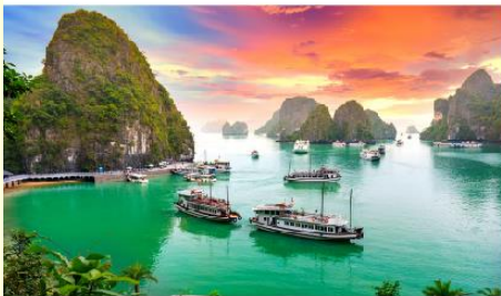
ล่องเรือชมอ่าวฮาลอง