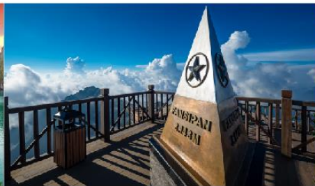
ยอดเขาฟานซิปัน