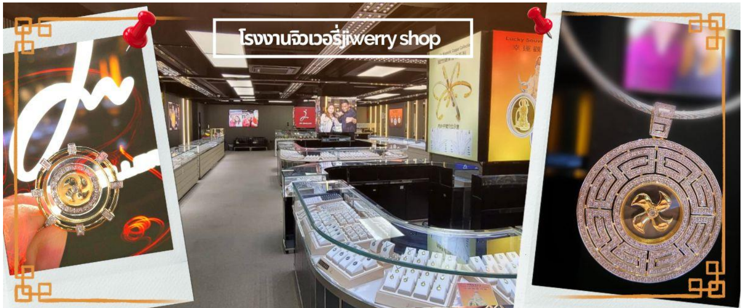
โรงงานจิวเวอรี่jewery shop

“วันเปิดทรัพย์” หรือ วันยืมเงินเทพเจ้า เป็นวันที่จะมาขอพรและยืมเงินเจ้าแม่กวนอิม ซึ่งตรงกับวันที่ 26 นับจากวันตรุษจีน ซึ่งพิธีนี้ใน 1 ปี มีเพียงครั้งเดียวเท่านั้น จากนั้นนำท่านชม โรงงานจิวเวอรี่ ซึ่งเป็นโรงงานที่มีชื่อเสียงที่สุดของฮ่องกงในเรื่องการออกแบบเครื่องประดับ อาทิเช่น จี้ และแหวนกำหั้น ที่สวยงามโดดเด่นไม่เหมือนใคร ซึ่งถือกำเนิดขึ้นที่นี่และมีชื่อเสียงที่สุดใช้เป็นเครื่องประดับติดตัว และเสริมดวงชะตา สินค้าทุกชิ้นมีเอกสารรับประกันคุณภาพเปลี่ยน ซ่อม ได้ตลอดอายุการใช้งาน หากเกิดการชำรุดจากสินค้าไม่ใช่อุบัติเหตุ และนำท่านเลือกซื้อ เครื่องประดับที่ ร้านหยก ซึ่งคนจีนนั้นถือว่าหยกเป็นหิน ที่เป็นตัวแทนของความสวยงามและความบริสุทธิ์ มีความเชื่อว่าหยกมงคล ถ้าพกติดตัวไว้จะอายุยืนและสุขภาพดี