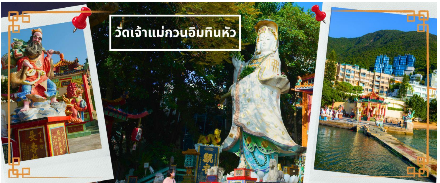
วัดเจ้าแม่กวนอิมทินหัว

ตั้งอยู่ริมทะเล เป็นสถานที่ท่องเที่ยวสำคัญ สร้างขึ้นในปี ค.ศ.1993 วัดแห่งนี้ถูกสร้างขึ้นเพื่อคุ้มครองชาวประมง ในการออกเรือไปหาปลา ซึ่งเป็นหนึ่งในวัดที่เก่าแก่ที่สุดของฮ่องกง บริเวณวัดจะมี เจ้าแม่กวนอิมองค์ใหญ่ ปาง ประทานพรตั้งอยู่ เป็นเทพที่ชาวฮ่องกงและคนจีนให้ความเคารพนับถือมากที่สุด สามารถขอพรได้ทุกเรื่อง วัดนี้ เป็นที่นิยมมีนักท่องเที่ยวเดินทางมาขอพรกันมากมาย เพราะเชื่อในความศักดิ์สิทธิ์ และยังมี เจ้าแม่ทับทิม หรือ เทพธิดาแห่งท้องทะเลองค์ใหญ่ ซึ่งคนฮ่องกง คนมาเก๊า และคนจีน ที่อยู่ริมทะเล ชาวประมง นักเดินเรือหรือผู้ ที่เดินทางทางเรือเป็นประจำ จะนับถือเจ้าแม่ทับทิมเป็นอย่างมาก มีความเชื่อว่าเจ้าแม่ทับทิมจะปกป้องเราจาก ภัยอันตรายระหว่างการเดินทาง ภายในวัดยังมีเทพเจ้าและพระพุทธรูปต่างๆ ประดิษฐานไว้มากมายตามความ เชื่อถือศรัทธา เช่น เทพเจ้าไฉซิงเอี้ย ให้อายุโชคลาภความมั่งคั่ง ความร่ำรวย, พระสังกัจจายน์โพธิสัตว์ เทพ ประทาน บุตร-ธิดา ให้อายุโชคลาภขอลูก, สะพานต่ออายุ (สะพานอายุยืน) สะพานสีแดงตั้งอยู่บนริมหาด สี แดงสด เชื่อกันว่า คนจีนเชื่อกันว่าหากเดินข้ามสะพานนี้ เราจะมีอายุยืนขึ้นอีก 3 วัน (3 วัน บนสวรรค์ = 3 ปี บนโลกมนุษย์) นั้นหมายความว่า ถ้าเราเดินข้ามสะพานนี้แล้ว จะมีอายุยืนยาวขึ้นอีก 3 ปี บนโลกมนุษย์, เทพ เจ้าแห่งความรัก ให้อายุเนื้อคู่, ศาลา 8 เหลี่ยม เชื่อกันว่าเป็นจุดที่มีดวงจ้ายดีที่สุด ภายในศาลาแปดเหลี่ยม จุด กึ่งกลางของพื้นจะมีรูปแปดเหลี่ยม ให้เราไปยื่นขอพรจากตำแหน่งนี้เพื่อขอพรหลังจากสวรรค์ และอีกมากมายให้ ท่านได้สักการะบูชา