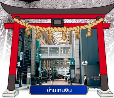
ย่านเกนจิน