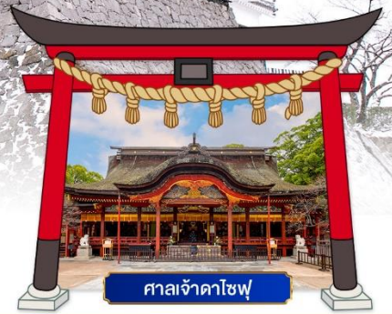
ศาลเจ้าดาไซฟุ