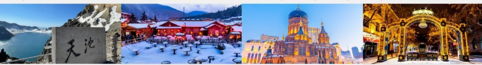
อุทยานฉางไป๋ซาน