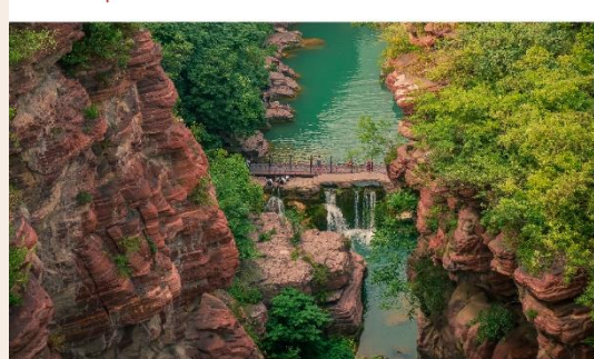
อุทยานสวรรค์หยุนโกซาน