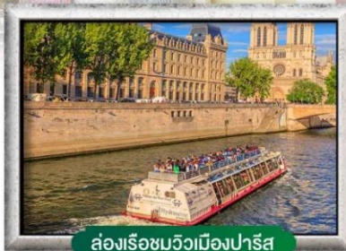
ส่องเรือชมวิวเมืองปารีส