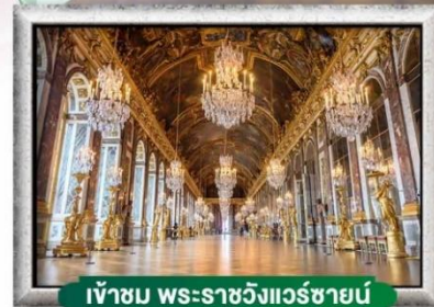
เข้าชม พระราชวังแวร์ซายน์