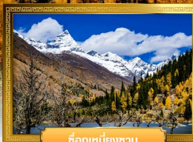
ชื่อภูเขาเหินยงซาน