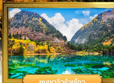
หุบเขาจิวจ้ายโกว