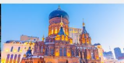
โบสถ์เซนต์ไอแซค

*ทางบริษัทฯ ขอสงวนสิทธิ์ในการสลับโปรแกรมทัวร์ตามความเหมาะสมขึ้นอยู่กับสถานการณ์หน้างาน โดยคำนึงถึงผลประโยชน์ของลูกค้าเป็นสำคัญ