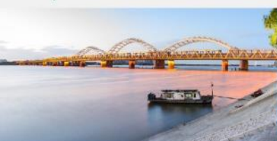
สะพานชงฮัวเจียง