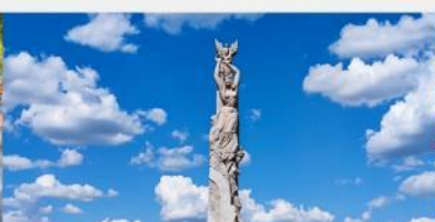
สวนประติมากรรมโลกฉางซุน