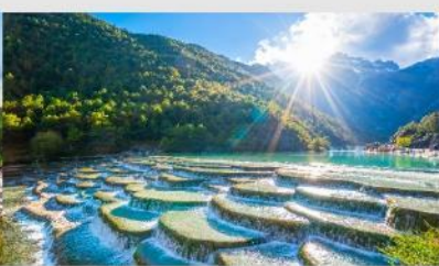
ทะเลสาบไป๋สู่ยเหอ