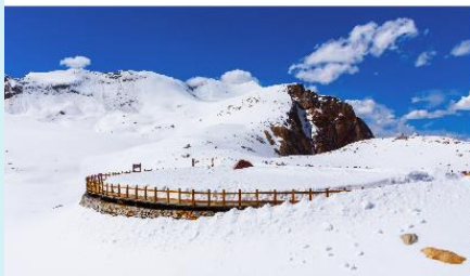
อุทยานต่ากู่ปิงชว่น