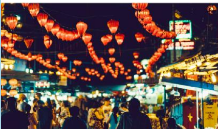
ตลาดกลางคืนญาจาง