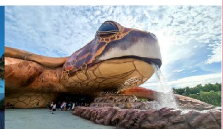
อควาเรียมเต่า

*ทางบริษัทฯ ขอสงวนสิทธิ์ในการสลับโปรแกรมทัวร์ตามความเหมาะสมขึ้นอยู่กับสถานการณ์ปัจจุบัน โดยคำนึงถึงผลประโยชน์ของลูกค้าเป็นสำคัญ