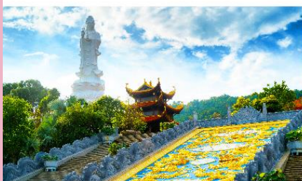
วัดโฮก๊วก