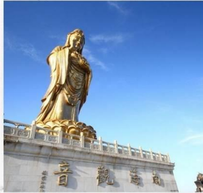
เกาะผู้โถวซาน