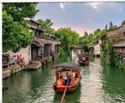
เมืองโบราณอูเจิ้น