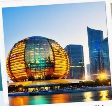
HANGZHOU CITY BALCONY