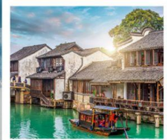
เมืองโบราณอูเจิน