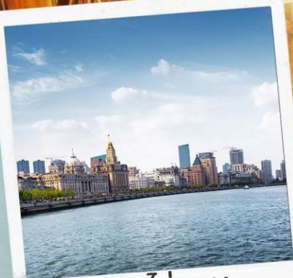
หาดไ่ว่ทาน