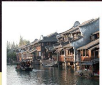
เมืองโบราณผานหลงกู่เงิน