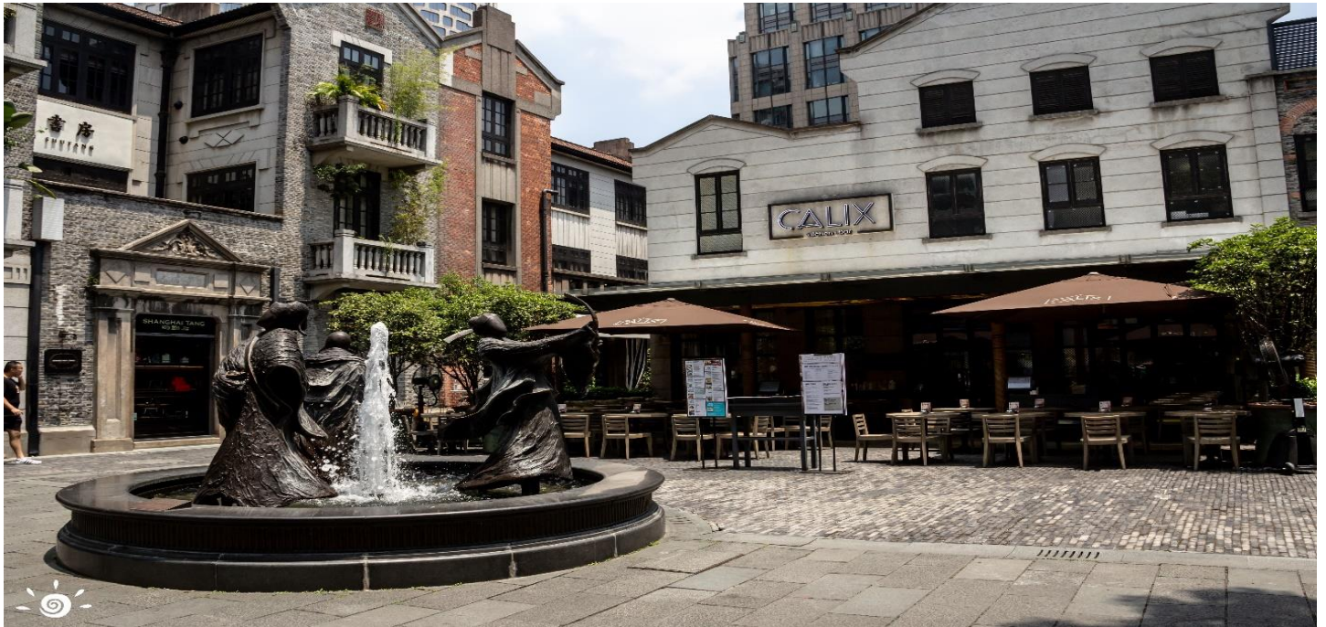
👉 พักที่ SHANGHAI HOLIDAY INN EXPRESS HOTEL หรือเทียบเท่าระดับ 4 ดาว

หลังอาหารเช้านำท่านเที่ยวชม ซินเทียนตี้ ย่านฮิปเตอร์ริคกลางนครเซี่ยงไฮ้ ที่วัยรุ่นต้องมา กลายเป็นสถานที่ท่องเที่ยวติดอันดับต้นๆไปแล้ว สำหรับแหล่งช้อปปิ้งแห่งนี้ ไม่แพ้แหล่งช้อปปิ้งรุ่นพี่ อย่าง ถนนนานกิง ถนนคู่เจียง Yu Yuan Bazaar ถือว่าเป็นอีก 1 ไฮไลท์เด็ดของนครแห่งนี้ เนื่องจากเอกลักษณ์ที่ไม่เหมือนใคร สิ่งปลูกสร้างที่ใช้วัสดุแบบสถาปัตยกรรมแบบ Shikumen (ซิกเหมิน) การผสมผสานระหว่างสถาปัตยกรรมตะวันตกกับจีนเข้าด้วยกัน ทางเดินหิน กำแพงหิน ประตูหิน บ้านเมืองเก่าแต่ดูแลรักษาอย่างดี