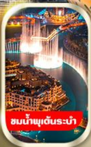
ชมน้ำพุเด็นระบำ

นั่งรถ 4WD ชมทะเลทรายอาหรับ พร้อมทานดินเนอร์อาหรับ