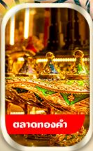
ตลาดทองคำ