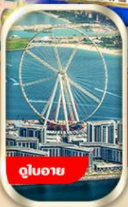
ดูใบอ้าย