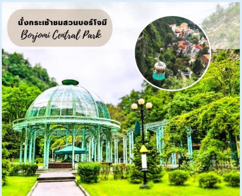
นั่งกระเช้าชมสวนบอร์โจมี Borjomi Central Park

ชม สวนบอร์โจมี (Borjomi City Park) สถานที่ท่องเที่ยวและพักผ่อนของชาวเมืองบอร์โจมีที่นิยมมาเดินเล่น และผ่อนคลาย โดยการแช่น้ำแร่ในวันหยุด จากนั้นนำท่านนั่งกระเช้าสู่จุดชมวิวบนหน้าผาเหนือสวนบอร์โจมี