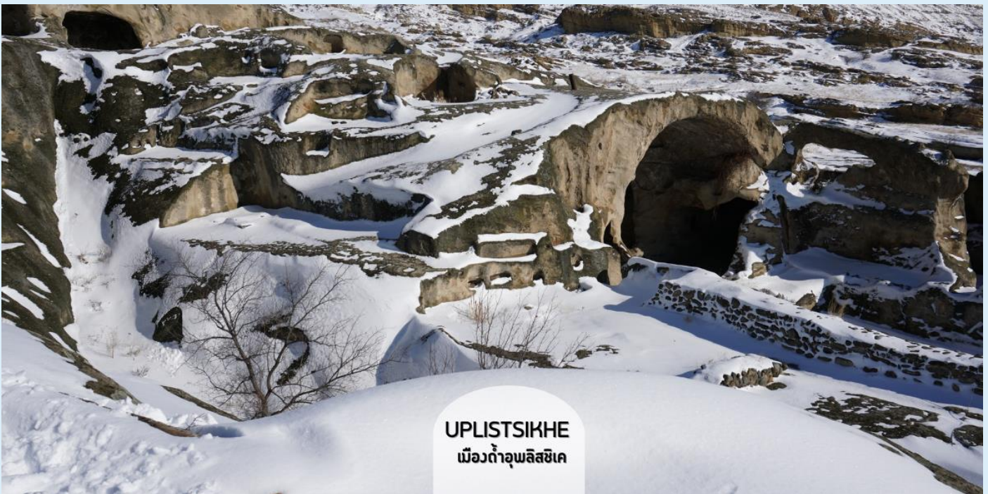
UPLISTSIKHE เมืองถ้ำอุปลิสซิกเค

ชมเมืองถ้ำโบราณอุปลิสซิกเค (Uplistsikhe) ตามภาษาจอร์เจีย แปลว่า “ป้อมปราการของขุนนาง” สัญลักษณ์ของความโบราณและความเป็นเอกลักษณ์ของจอร์เจีย อายุกว่า 3,000 ปีแล้ว เมืองนี้ใช้การสร้างโดยเจาะภูเขาหินจนลึกเข้าไปเป็นถ้ำ และมีการอยู่อาศัยกันจนเป็นชุมชนใหญ่ มีทั้งที่พักอาศัย ร้านค้า โบสถ์ คูหา ฯลฯ รอบๆ เมืองยังมีวิวเทือกเขา และแม่น้ำมีควารีที่สวยงามด้วยเมืองถ้ำ ทั้งหมดถูกสร้างขึ้นตั้งแต่สมัยต้นยุคเหล็ก จนถึงปลายยุคกลาง ที่ให้กลิ่นอายผสมผสานระหว่างวัฒนธรรมของดินแดนอนาโตเลียของตุรเคีย ผสมผสานกับดินแดนเปอร์เซียของอิหร่าน โดยนักโบราณคดีได้สันนิษฐานว่าที่นี่ถือเป็นแหล่งที่อยู่อาศัยที่เก่าแก่ที่สุดในประเทศ ปัจจุบันได้รับการขึ้นทะเบียนให้เป็นมรดกโลกโดยองค์การยูเนสโก