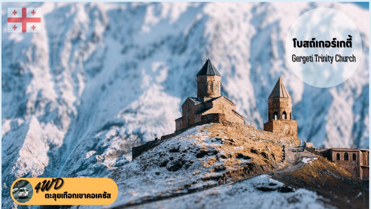
โบสถ์เกอร์เกตี Gergeti Trinity Church

นำท่านขึ้นรถ 4WD (รถขับเคลื่อน 4 ล้อ) มุ่งหน้าสู่ใจกลางหุบเขาคอเคซัส (Caucasus) ระหว่างทางชมบรรยากาศความอลังการความงดงามของเทือกเขาคอเคซัส แวะชมความสวยงามของ โบสถ์เกอร์เกตี (Gergeti Trinity Church) หรือเรียกว่า โบสถ์สมินดา ซาเมบา โบสถ์ชื่อดังกลางหุบเขาคอร์เคซัสบนเนินเขาเหนือหมู่บ้านเกอร์เกตี เป็นสัญลักษณ์สำคัญหนึ่งของประเทศจอร์เจีย โบสถ์เก่าแก่สร้างขึ้นในศตวรรษที่ 14 ทำด้วยหินแกรนิตขนาดใหญ่