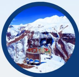
จุดถ่ายรูป Panorama Gudauri