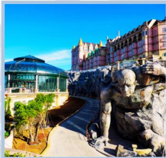
โซอ Eclipse Square