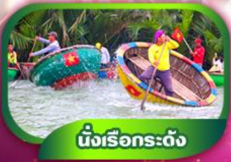
นั่งเรือกระดง