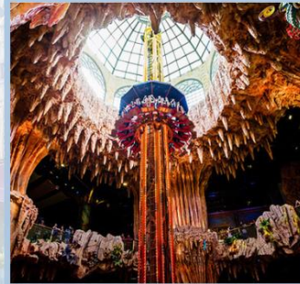
สวนสนุก Fantasy Park