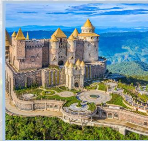
ปราสาทจันตรา