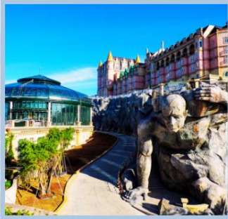
โซล Eclipse Square