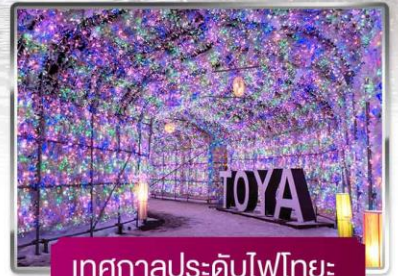
เทศกาลประดับไฟไทยะ