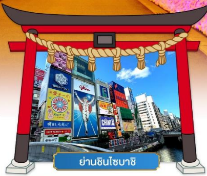
ย่านชินโซบาชิ