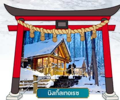
นิงเกิ้ลเทอเรซ