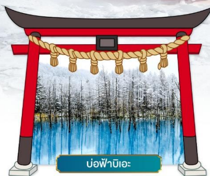
บ่อน้ำบิเอะ

ชมความสวยงามท่ามกลางหิมะ ณ หมู่บ้านเทพนิยาย นิงเกิ้ลเทอเรซ