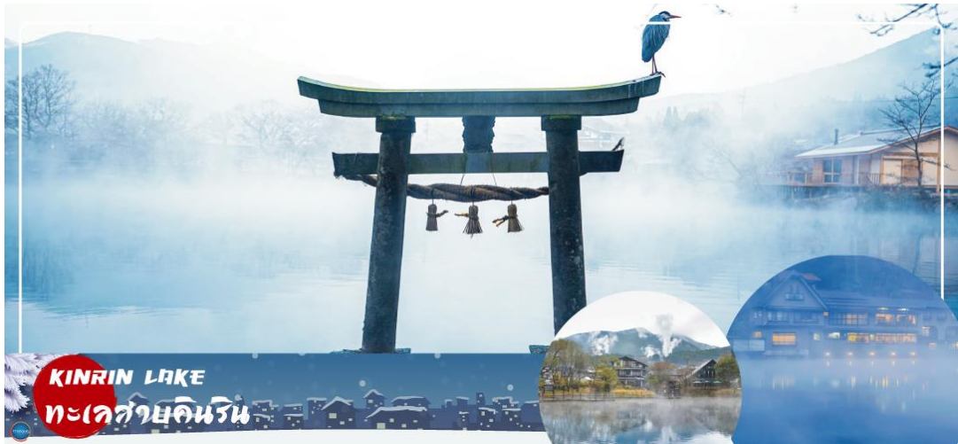
KINRIN LAKE ทะเลสาบคิริน