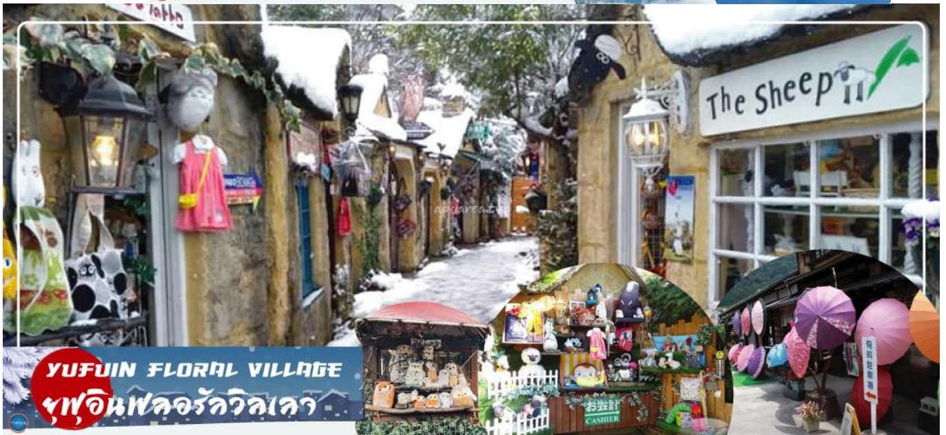
YUFUIN FLORAL VILLAGE หมู่บ้านฟลอรัลวิลเลจ