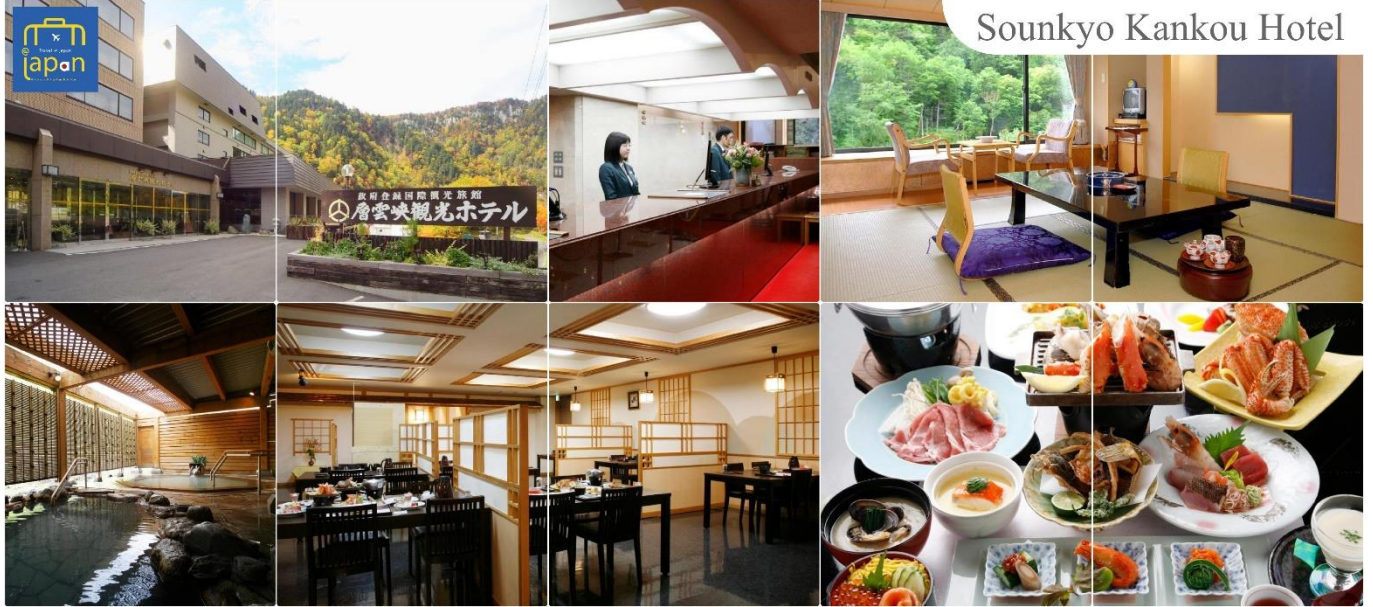
Sounkyo Kankou Hotel

สถาปัตยกรรมจากน้ำแข็งขนาดใหญ่กว่า 30 ชั้นตั้งเรียงราย และในช่วงกลางคืน น้ำแข็งเหล่านี้จะสะท้อนแสงไฟสีรุ้งราวกับโลกแห่งจินตนาการ รับประทานอาหารค่ำ ณ ห้องของโรงแรม (5) SOUNKYO KANKOU HOTEL หรือเทียบเท่าระดับเดียวกัน หลังอาหารให้ท่านได้ผ่อนคลายกับการแช่น้ำแร่ธรรมชาติ เชื่อว่าถ้าได้แช่น้ำแร่แล้ว จะทำให้ผิวพรรณสวยงามและช่วยให้ระบบหมุนเวียนโลหิตดีขึ้น