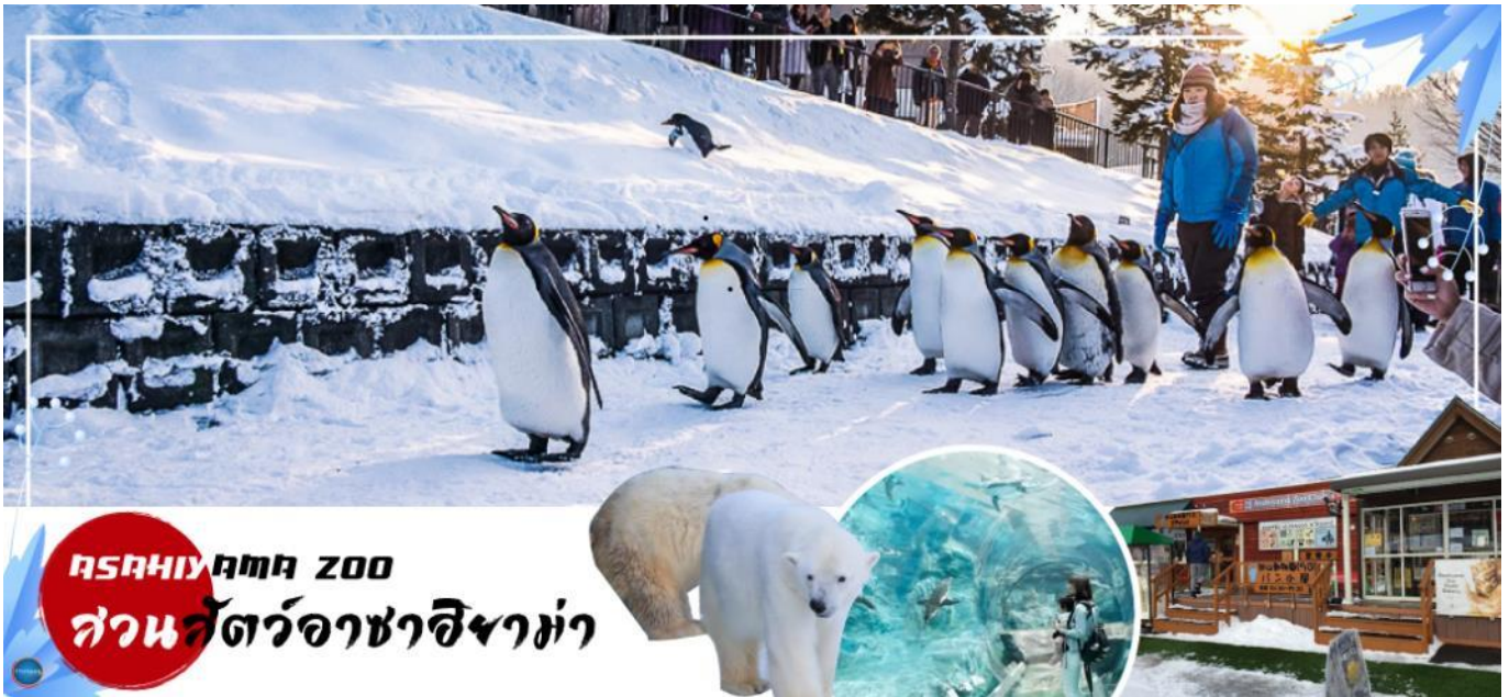
ASAHIYAMA ZOO สวนสัตว์อาซาฮิยาม่า

เมืองอาซาฮิกาวา – สวนสัตว์อะซาฮิยาม่า – หมู่บ้านรามงอะซาฮิยาม่า – เมืองซัปโปโร – ซัปโปโร – ซัปโปโร