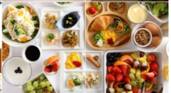
HOTEL B Suites