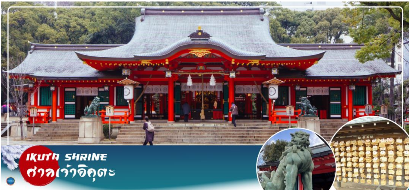
IKUTA SHRINE ศาลเจ้าอิคุตะ

จากนั้นนำท่านสักการะ ศาลเจ้าอิคุตะ (Ikuta Shrine) ตั้งอยู่ในย่านใจกลางเมืองซันโนะมิยะ (Sannomiya) เป็นศาลเจ้าที่มีประวัติศาสตร์ยาวนาน ก่อตั้งในปี 201 หนึ่งในสามศาลเจ้าหลักของโกเบที่มีประวัติศาสตร์ยาวนานกว่า 1,800 ปี ทางเหนือไปตามถนนชื่อถนนอิคุตะ คุณจะเห็นทางเข้าศาลเจ้าพร้อมประตูโทริอิที่สร้างโดยใช้วัสดุรีไซเคิลจากศาลเจ้าใหญ่อิเสะ ศาลเจ้าอิคุตะมีชื่อเสียงในด้านผลประโยชน์ในการจับคู่ เนื่องจากจิตอธิษฐานขอเป็นเทพเจ้าผู้ทอเสื้อผ้าของเทพเจ้า และเธอทอด้วยและด้ายเข้าด้วยกัน คนในพื้นที่เรียกกันอย่างเสนาหว่า "อิคุตะซัง"