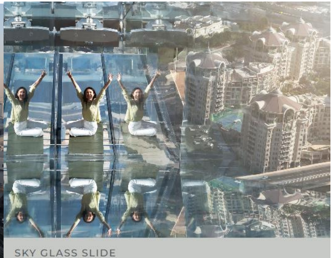
SKY GLASS SLIDE