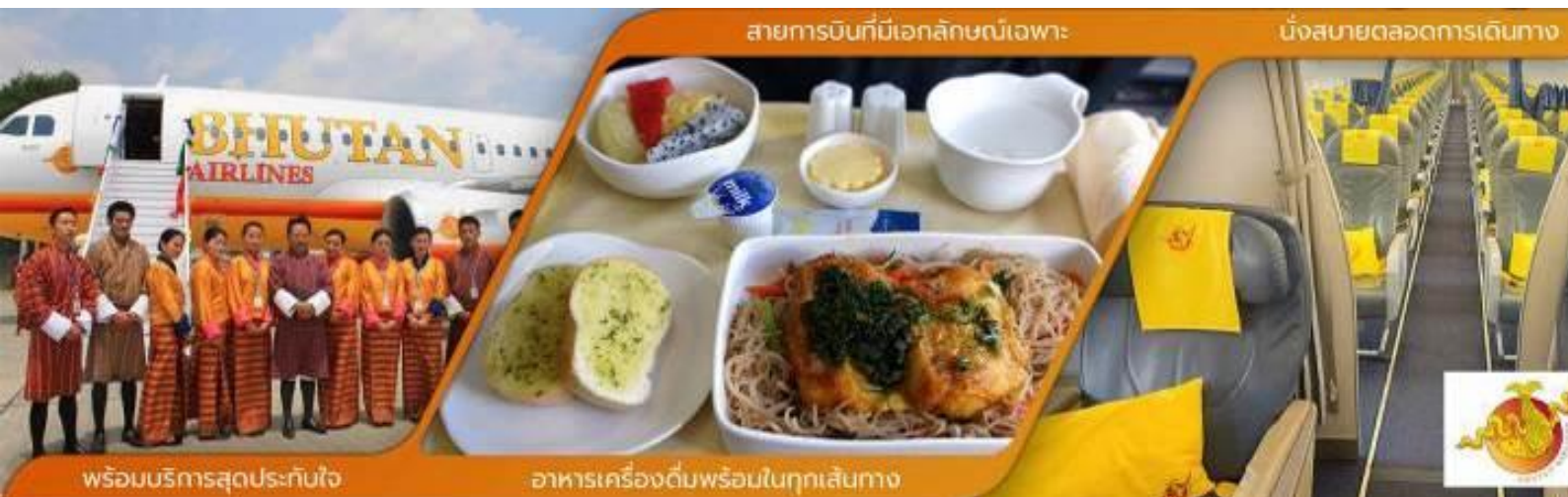
สายการบินที่มีเอกลักษณ์เฉพาะ

(เครื่องบินแวะรับส่งผู้โดยสารที่เมืองกัลกัตตา ประเทศอินเดียประมาณ 45 นาที ***ไม่ต้องลงจากเครื่อง*** )