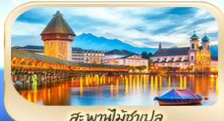
สะพานไมซ์าเปค