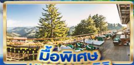
มือพิเศษ บนยอดเขาริกิ