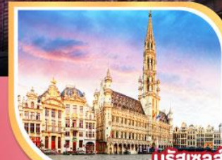
บรัสเซลส์