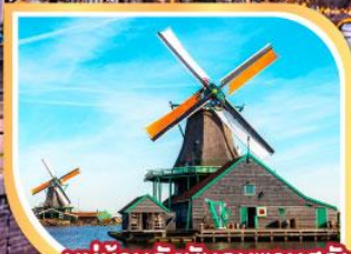
หมู่บ้านกังหันลมชานสคันส์