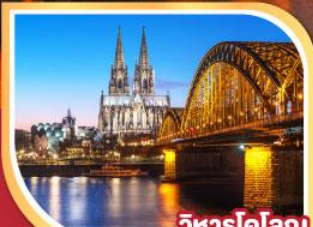
วิหารโคโลญ

28 ธ.ค. 67-04 ม.ค. 68 04-11 ม.ค. 68 18-25 ม.ค. 68 25 ม.ค.-01 ก.พ. 68